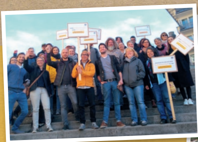
Das WeltPartner Team im Einsatz für konsequenten Klimaschutz – hier auf einem der Globalen Klimastreiks.