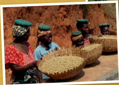
Kaffee- und Gemüseanbau bei COCOCA in Burundi.

Das Projekt setzt auf ein Zusammenspiel von Eigenversorgung als höchste Priorität, der nachhaltigen Nutzung von aufzuforstenden Flächen und der Einbindung von Bio-Anbau und der Vermarktung des Bio-Kaffees an WeltPartner als „cash crop“. Davon profitieren über 11.000 Familien mit insgesamt ca. 77.000 Personen. Neben dem Kaffeeanbau wird auch auf Bananen, Obst- und Schattenbäume sowie Gemüsekulturen gesetzt, die zur Ernährungssicherung beitragen und die Bodenfruchtbarkeit verbessern. Das sorgt für eine Erhöhung der Erträge und steigert den Grad der Selbstversorgung.